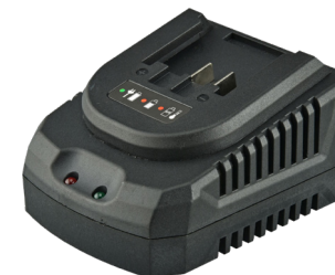
BC 18F, BC 20-2.4, BC 20-4