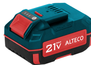
BCD 21-40 Li, BCD 21-50 Li, BCD 21-60 Li