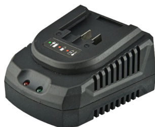
BC 18F, BC 20-2.4, BC 20-4