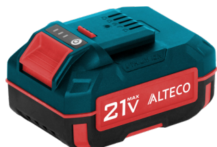
BCD 21-40 Li, BCD 21-50 Li, BCD 21-60 Li